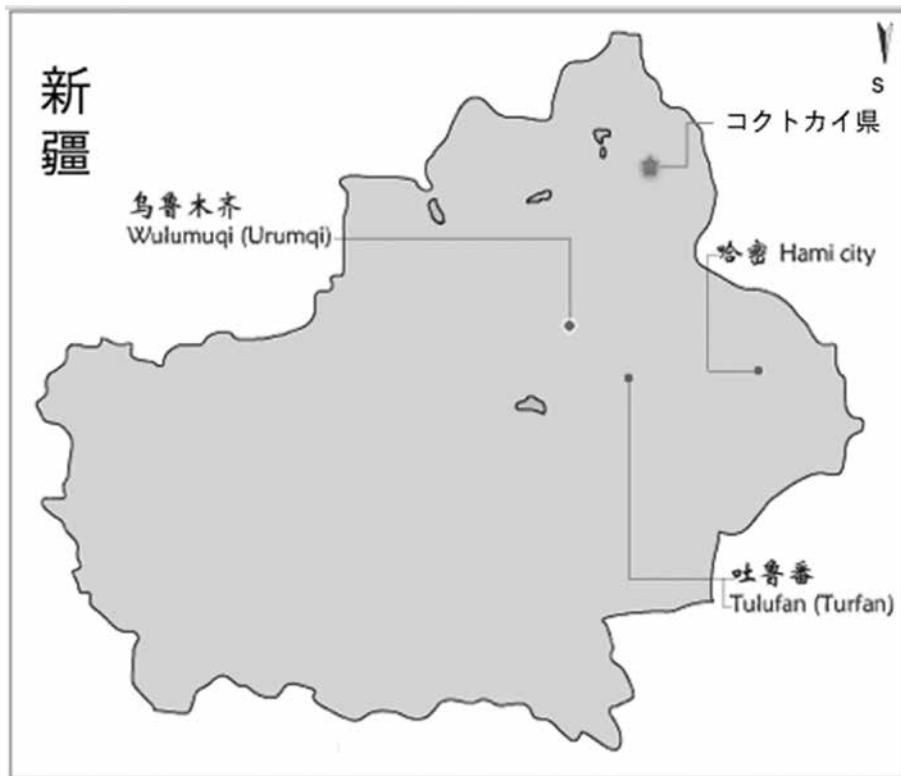
図1：新疆ウイグル自治区におけるコクトカイ県の位置