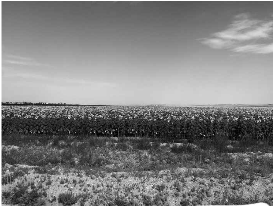
写真1 牧草地が農地に転換された様子

ドゥルー鎮への往復の道中では、道の両側に広がっているヒマワリ畑が目についた（写真1）。ドゥルー鎮の四つの村落を周り調査し、それぞれ牧畜業生産・生活を行っていることを考察した。各村落の共通した特徴として、どんな村落でも農地流動もあることに気づけた。表1は観察・調査を行った村落の現状を整理したものである。